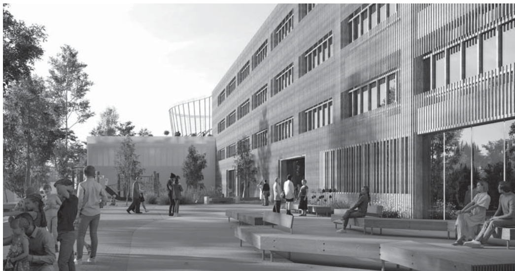
Vizualizace svazkové školy Malše.

Bude tomu už téměř rok, co po volbách do obecních zastupitelstev zazněl na setkání starostů svazu měst a obcí Pomalší návrh ze strany obce Doudleby na postavení základní školy. Začali jsme se tímto nápadem vážně zabývat hlavně v souvislosti s katastrofálním nedostatkem spádových škol pro jednotlivé obce. Ale kde jí postavit? Šťastnou náhodou se obci Vidov podařilo odkoupit 40 let chátrající areál bývalé úpravny vod přímo v centru obce. Tento objekt se k využití pro stavbu zamýšlené školy nabízí, a tak začalo intenzivní jednání starostů Pomalší, kteří by měli zájem se na zamýšlené škole podílet. Do tohoto projektu bylo připraveno vstoupit celkem osm obcí – Vidov, Nová Ves, Doudleby, Střížov, Borovnice, Heřmaň, Komařice a Plav. O možném vstupu dalších uchazečů se dále jedná. Co je ale asi nejdůležitější, že jde o projekt školy s oběma stupni, která bude připravena pojmout 540 žáků. Jestli bude možné ze zmíněných obcí takovou školu zaplnit, naznačuje základní demografická prognóza, která se nechala zpracovat jako podklad pro další jednání.