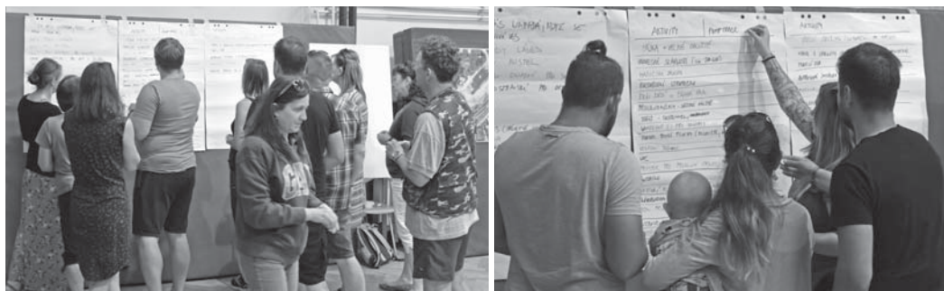
Účastníci se pomocí barevných lepiček sami podíleli na návrhu úprav.