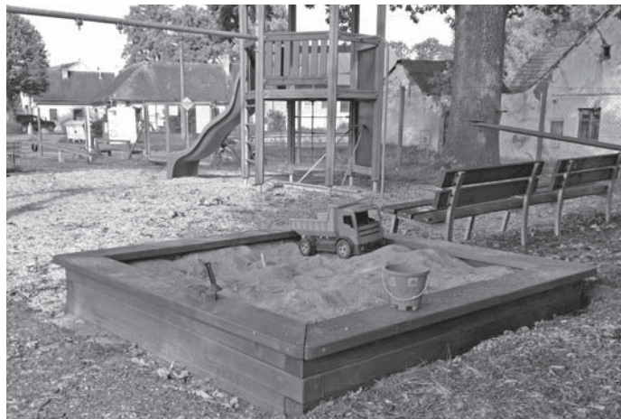
mp Nově umístěné pískoviště v areálu dětského hřiště ve staré části Nové Vsi.

Abychom alespoň částečně uspokojili hlad po vyzítí, došlo k dohodě se zástupci Tělovýchovné jednoty Nová Ves o umístění nových certifikovaných herních prvků do areálu jejich sportoviště. V podstatě se nahradilo odstraněné a nevyhovující staré dřevěné hřiště v rohu areálu TJ. Dohoda mezi Obcí Nová Ves a činovníky spolku poskytuje prostor pro umístění herních prvků v majetku obce. Ty budou dle možností průběžně doplňovány.