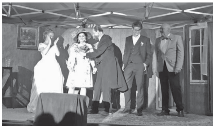
Děkovačka s kyticí pro „paní Hubleyovou“.