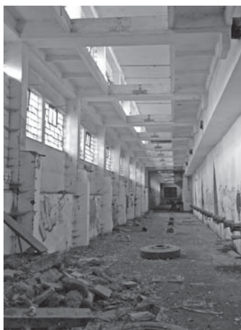
Současný stav objektu.